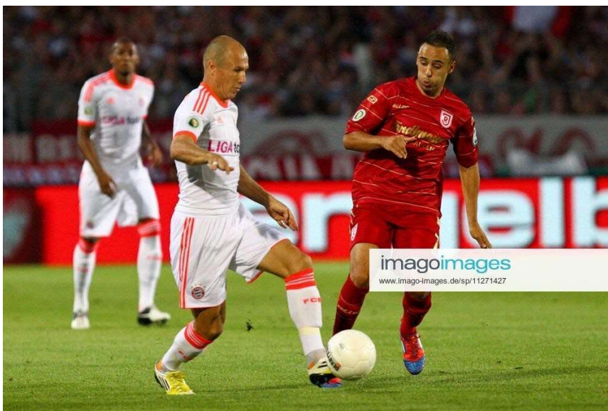
Abdenour im Duell mit Arjen Robben

Den zweiten Teil des exklusiven Interviews lesen Sie im nächsten Fan-Boten!