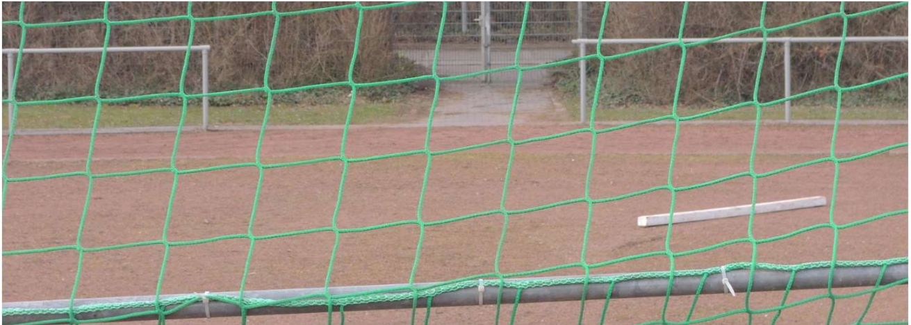
Am Tennisplatz der Buirer Borussia entsteht ein neuer Kunstrasenplatz

Der Ausschuss für Sport, Freizeit und Kultur der Stadt Kerpen hat in seiner Sitzung am 15.03.2022 eine zukunftsweisende Entscheidung für den gesamten Ortsteil getroffen: es wurde beschlossen, am aktuellen Standort des Tennisplatzes eine neue Sportanlage zu bauen.